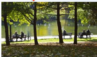
dans un espace public