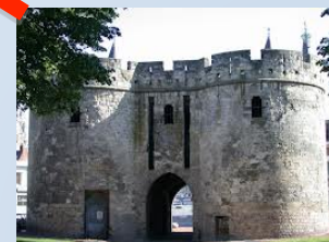
aux portes de la ville