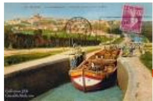
Canal du midi