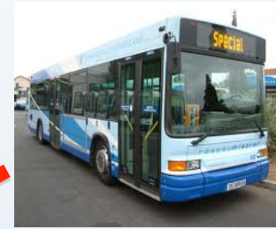
en transport en commun