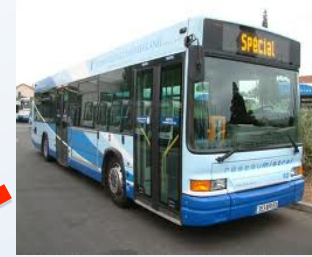
en transport en commun