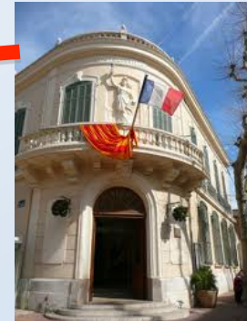
à l'hôtel de ville