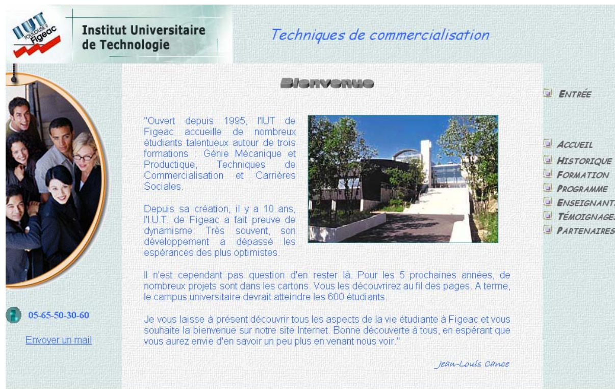
Figure 2 : Page de cadre initiale.

La page de cadre, dans configuration initiale est semblable à la capture d'écran ci-dessous.