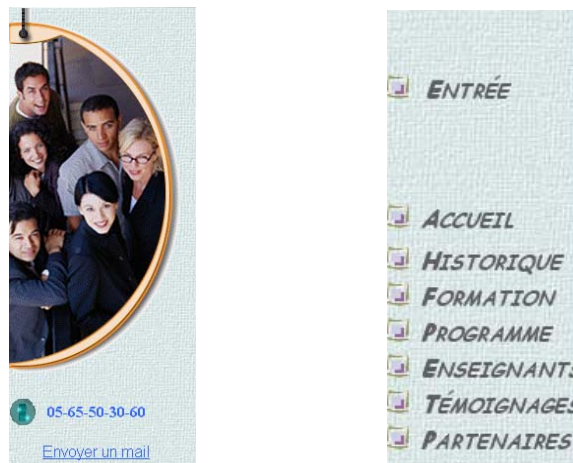
Figure 4 : Pages « gauche.htm » et « droite.htm ».

Pour l'instant, seul le texte « Entrée » possède un lien hypertexte vers la page d'index. Celle-ci devra apparaître en pleine page.